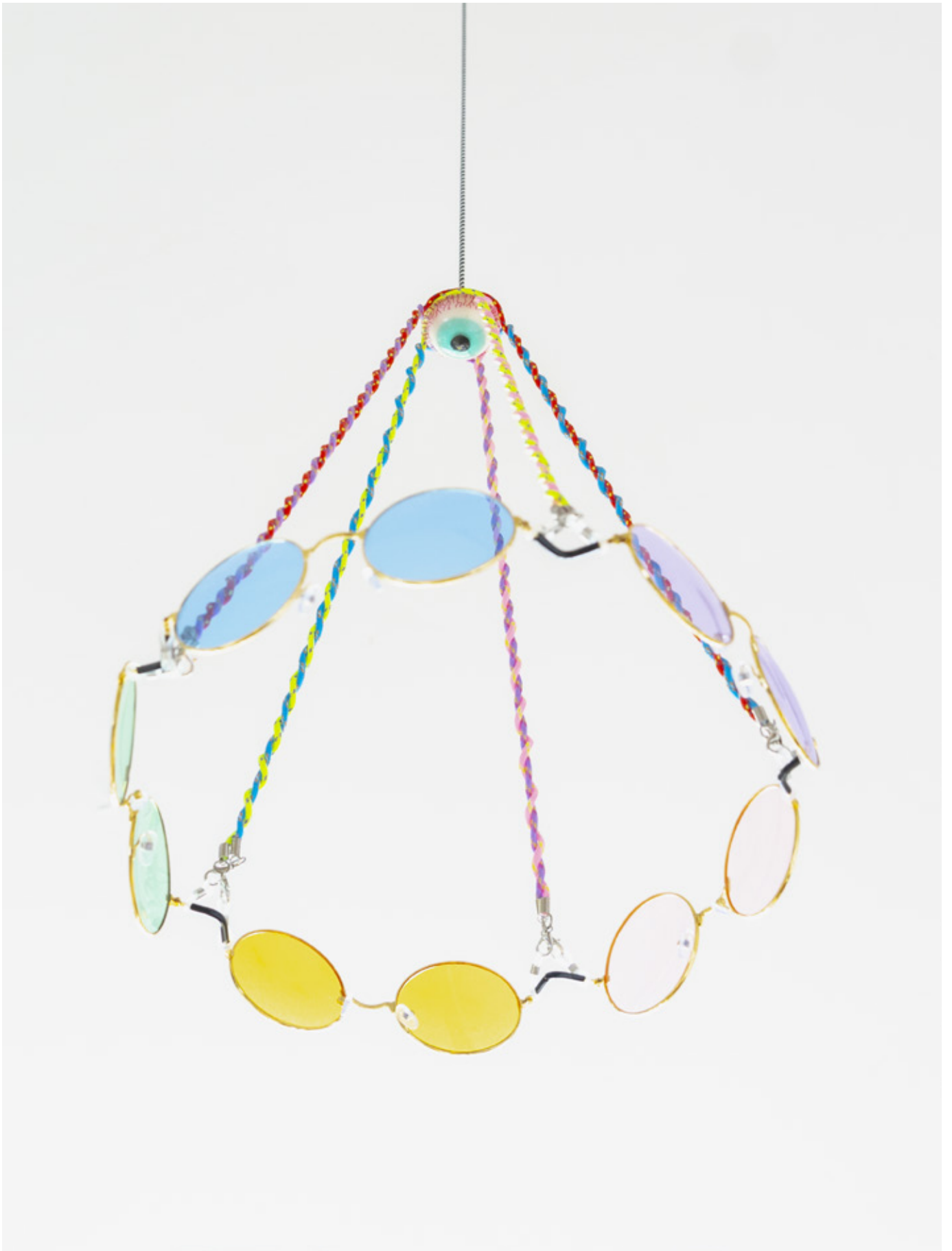
CAROLE LOUIS Faisceau, 2023