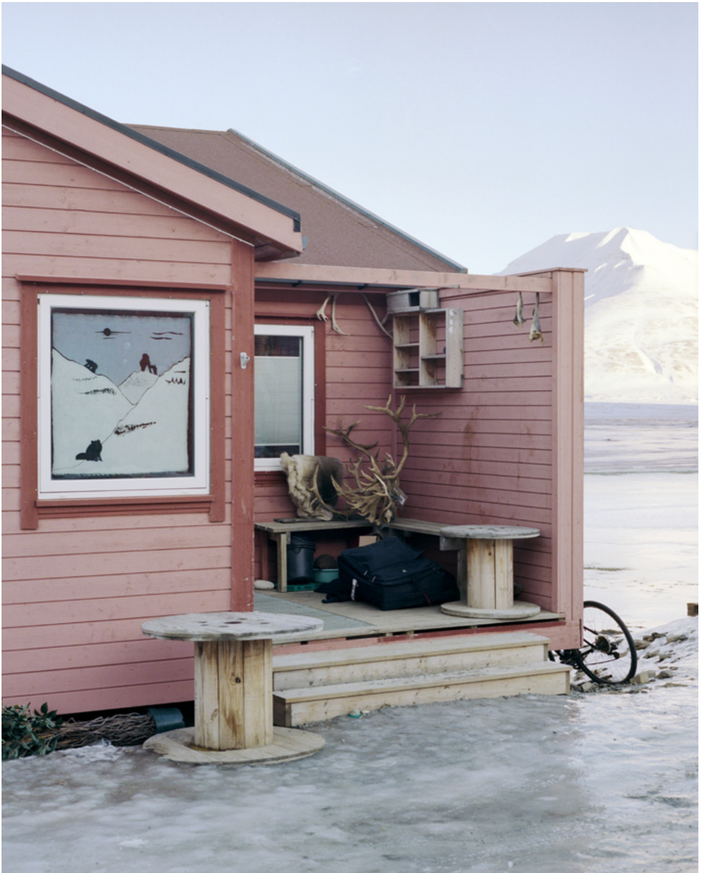
CATHERINE LEMBLÉ Vei 258, uit de serie Only Barely Still , 2018